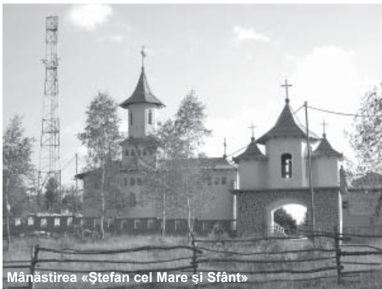
Mănăstirea «Ștefan cel Mare și Sfânt»