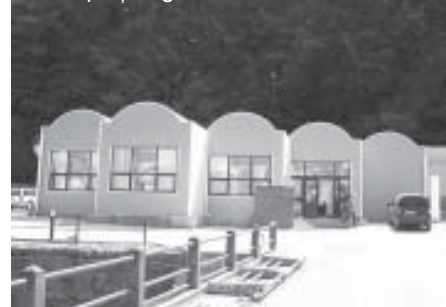
Noua piața agroalimentară