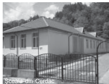
Școala din Cerdac