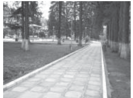
Parcul după modernizare